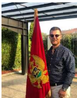
VILDAN RAMUSOVIĆ Predsjednik skupštine